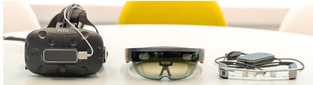
Virtual Reality (VR)