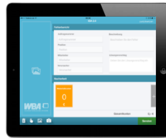
Beschreibung & Kategorisierung