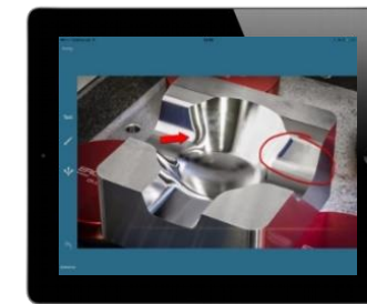
Fehlerauswertung & weitere Bearbeitung